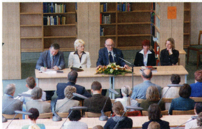
Spotkanie z Prof. Władysławem Bartoszewskim

Biblioteka stała się też miejscem spotkań Klubu Studenckiego „Kultura”.