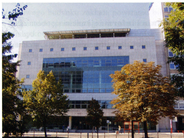
Nowy gmach biblioteki