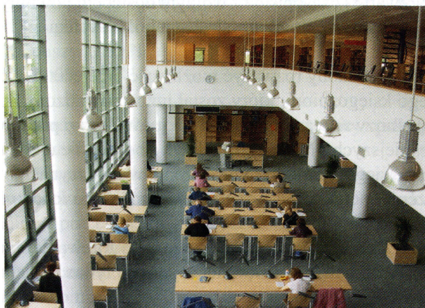
Czytelnia ogólna. Widok z trzeciego piętra

Udostępnianie prezencyjne odbywa się w 4 czytelnich: Czytelnia Czasopism i Czytelnia Oddziału Informacji Naukowej na I piętrze oraz w Czytelnia Ogólnej i Czytelnia Zbiorów Specjalnych usytuowanych na II piętrze. W czytelni ogólnej działa sygnalizacja świetlna informująca użytkowników o dostarczeniu zamówionych dokumentów z magazynów.