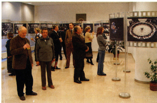
Otwarcie wystawy „Drogi do Wolności – Przez Solidarność do Europy”

W holu biblioteki prezentowane są wystawy, przygotowywane przez pracowników Oddziału Informacji Naukowej (m.in. poświęcona patronowi biblioteki J. Giedroycowi) oraz powstające we współpracy z instytucjami kulturalnymi i naukowymi. Z Regionem NSZZ „Solidarność” w Białymstoku oraz Fundacją Solidarności ze Stoczni Gdańskiej – udostępniono wystawę „Drogi do Wolności”, a wspólnie z NBP wystawę prac z konkursu fotograficznego „Polska – mój kraj”. Na lipiec zaplanowano wystawę książki Esperanto z Fundacją Zamenhofs oraz ekspozycję dotyczącą mniejszości narodowych.