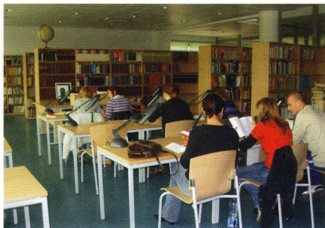
Czytelnia Oddziału Informacji Naukowej

Szczególne role w tym procesie przypada Oddziałowi Informacji Naukowej. Obsługa informacyjna użytkowników prowadzona jest w Czytelni Oddziału Informacji Naukowej oraz przyległej do czytelni pracowni informacyjno-bibliograficznej. Dodatkowo na parterze znajdują się pracownia dokumentacji i prac badawczych.